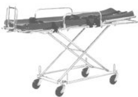
Barella non auto-caricante

Sulle ambulanze vecchie, la barella principale è NON AUTO-CARICANTE , ciò vuol dire, che può essere posizionata ad altezze diverse a seconda del bisogno, ma che sono necessari due operatori per caricarla, utilizzando l'apposita pedana in alluminio, ed ha tutte e quattro le ruote sterzanti che le permettono di essere "guidata" anche in luoghi particolarmente stretti.